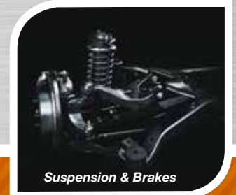
Suspension & Brakes