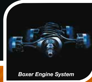
Boxer Engine System