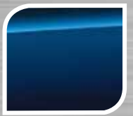
Galaxy Blue Silica

TRD hanya tersedia dengan warna Satin White Pearl, Crystal Black Silica, Orange ME & Lightning Red.