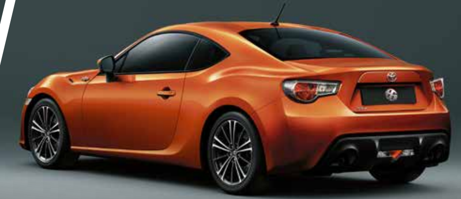
Tampilan minimalis dan tersedianya pilihan antara 6-speed M/T dan A/T ditujukan untuk memaksimalkan kepuasan para pengendaranya.