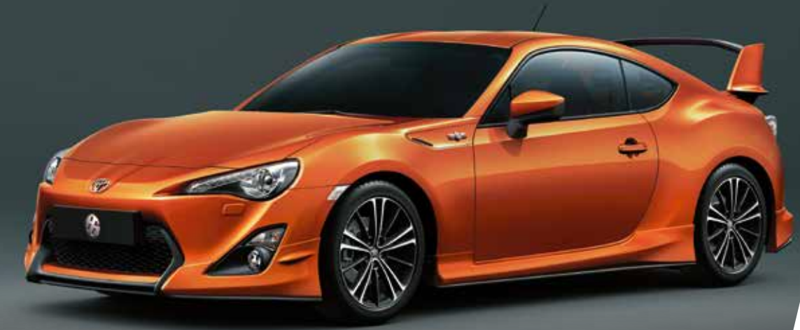
Tampilan bumper dengan lips, side skirt, dan spoiler belakang yang besar, memperkuat konsep aerodinamis dari 86 Aero.

Tanda kemenangan hari Anda dimulai saat deru nafas mesin Boxer FA20 dihidupkan. Kemampuannya yang luar biasa serta bobot mesin yang seimbang tetap menjuarai kenikmatan serunya berkendara bagi semua kalangan.